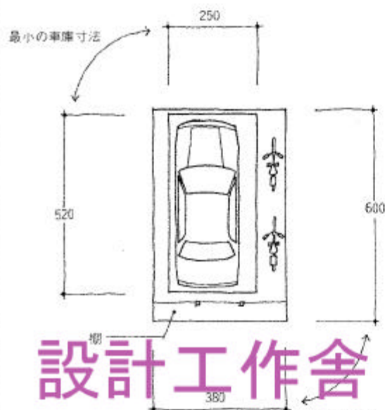
収納スペースを確保したゆとりの車庫寸法